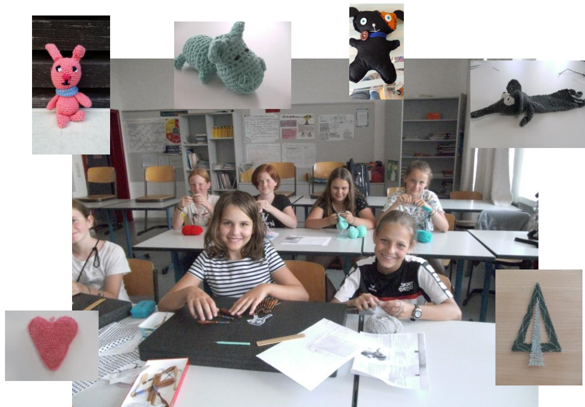
Handarbeits-AG am PG 2018/19