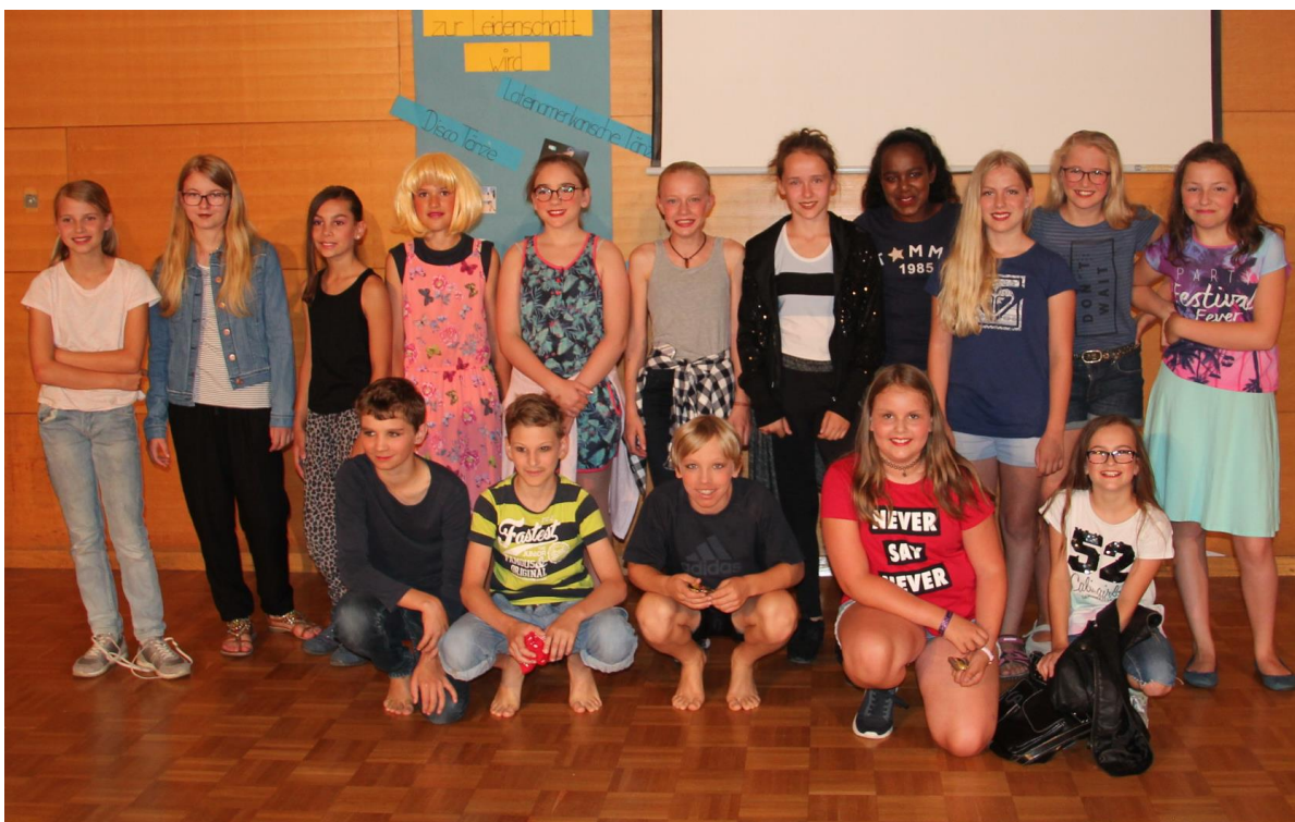
Theatertag am PG 2017/18